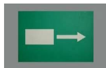
plaats van nooduitgang